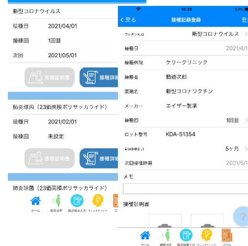
ワクチン接種登録